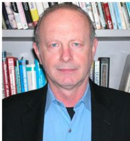
Immagine - 1 - Joseph LeDoux

Ora per i ragazzi è facile collegare i "disordini emozionali" e tanti loro malesseri. Ecco perché mi sudano le mani, ecco perché sbatto gli occhi, ecco perché non riesco a riportare per il cambio un acquisto difettoso e le tante paure sociali: paura di perdere il proprio passato (sindrome di Pollicino), paura di non essere all'altezza delle aspettative degli altri... paura di non poter dire la propria opinione o di non potersi ribellare a qualcosa o a qualcuno etc.