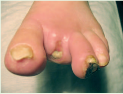
20.10.2005 - Sclerodermia al termine del terzo ciclo (3 mesi) di antibiotico-terapia mirata.