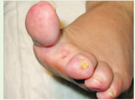
28.1.2006 - Dopo 3 mesi e mezzo di risciacqui.