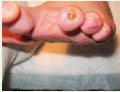
15.12.2005 - Dopo 2 mesi di risciacqui.